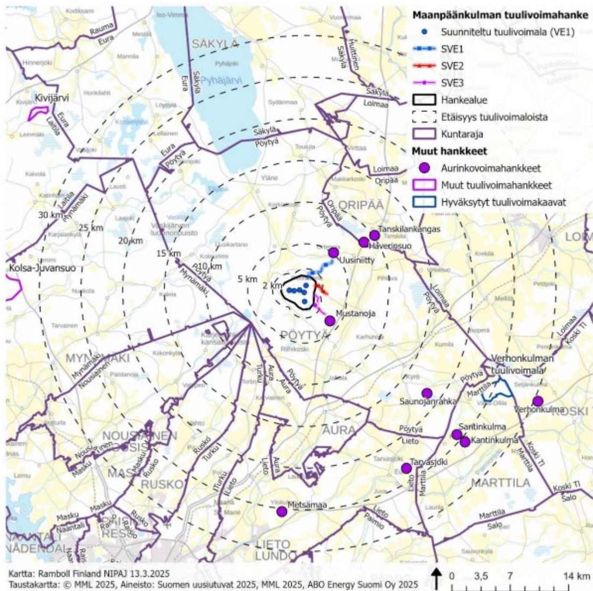
Kuva 8. Maanpäänkulman tuulivoimahankeen läheisyyteen sijoittuvat tuuli- ja aurinkovoimahankeet.